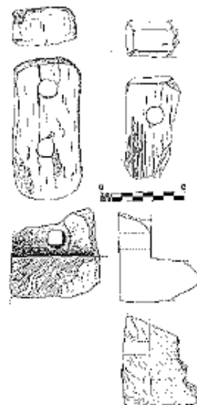
Objectes de fusta trobats a la cova

Malgrat la total remoció dels sediments de la tomba, i a l'extrema destrucció de les restes arqueològiques, es documentà la presència d'almenys dos tipus d'estructures llenyoses: civeres, consistents aparentment en dos barrots de llenya verticals, subjectes mitjançant clavilles a variis barrots paral·lels i horitzontals a ells, es a dir, formant una espècie d'escala ample i curta; i un segon tipus constituït per troncs d'arbre, buits a manera de caixa i tapats per una possible tapadora de llenya, també subjecte mitjançant clavilles. La majoria d'aquestes estructures eren de llenya d'ullastre. Malauradament totes aquestes estructures llenyoses estaven en estat tant fragmentari que no n'hem pogut reconstruir cap, però si que es pot tenir una idea aproximada de com eren originalment aquestes gràcies als nombrosos fragments i a paral·lels localitzats a la veïna illa de Mallorca que són de la mateixa època que els del hipogeu XXI.