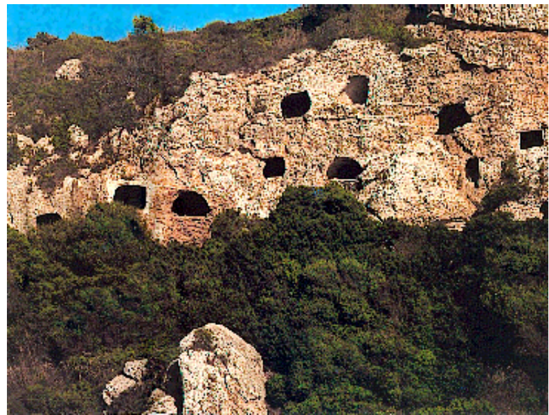
Vista d'un dels barrancs de Cales Coves.

L'hipogeu XXI s'excavà en la cara Est del Barranc de Biniadrís, i ocupa la posició més meridional respecte a la resta dels hipogeus de la necròpolis o cementiri. Per a excavar aquest hipogeu –paraula que etimològicament ve del grec hipo (davall) i gea (terra)- es va aprofitar una paret vertical del barranc de molt difícil accés, la qual cosa va obligar a construir un mur de pedres ciclòpies per a facilitar l'accés de les persones fins a la base de la tomba. Així i tot, resulta difícil arribar fins a la cambra, ja que hi ha que salvar un tallat de 6 mts. d'altura des de la plataforma artificial fins l'umbral de l'hipogeu. La cambra és espaiosa però fosca, de planta pseudorectangular de caires arrodonits o irregulars, d'uns 63 m 2 de superfície, i els seus eixos principals fan 8 mts de llarg per 10,5 mts d'ampla i té una altura mitja de 2mts. La tomba es va excavar artificialment a la roca emprant eines de tall lleugerament semicircular, les marques de les quals encara es poden veure a les parets de l'hipogeu.